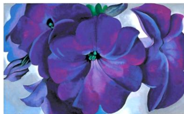
“Petunias” Georgia O’Keeffe

Puedes conocer más sobre Van Gogh visitando la siguiente página: vangoghgallery.com