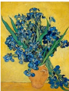
“Jarrón con lirios” Vincent Van Gogh

Les comparto 2 obras de reconocidos artistas donde pueden apreciar escalas de colores acordes.